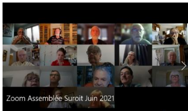
Assemblée générale de juin 2021 sur Zoom

L'Assemblée générale du jeudi 10 juin 2021 sur Zoom et la remise de l'Ordre de la Gratitude.