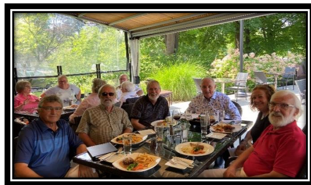
Comité de direction de l'AQDER Du Suroît, Juillet 2021, Salaberry-de-Valleyfield